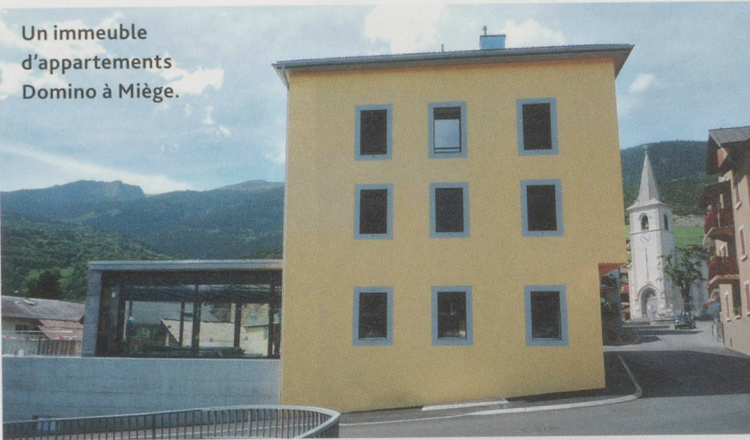
Un immeuble d'appartements Domino à Miège.