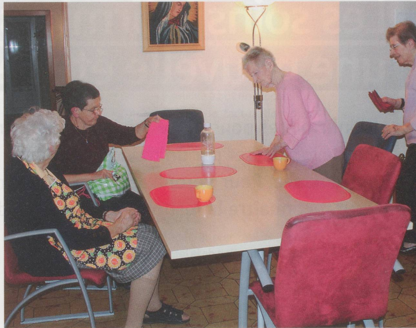
Un rôle social, mais pas d'horaires ni de règlement de maison.