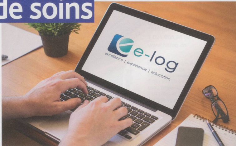
E-log aide à établir les compétences professionnelles.

red. La formation continue fait partie depuis longtemps des professions de soins. La plate-forme en ligne e-log aide à établir les compétences professionnelles rapidement et avec précision. Les professionnels des soins peuvent documenter leurs activités de formation continue dans leur portfolio e-log et ainsi compléter en tout temps les étapes de leur carrière. Depuis mi-mars, plus de 1000 personnes se sont enregistrées sur e-log.ch pour profiter de l'offre de cette plate-forme en ligne encourageant le développement professionnel. Après la création du profil, l'utilisateur peut télécharger ses diplômes et certificats de travail pour tenir à jour son curriculum vitae. L'agenda contient des offres de formation continue de la branche. Chaque formation continue donne droit à des points log. Un point log correspond à 60 minutes de performance éducative. L'Association suisse des infirmières et infirmiers (ASI), la Fédération suisse des infirmières et infirmiers anesthésistes (FSIA) et Curacasa, l'association suisse des infirmières indépendantes, ont élaboré des recommandations du nombre minimal d'heures que le personnel soignant devrait consacrer à sa formation