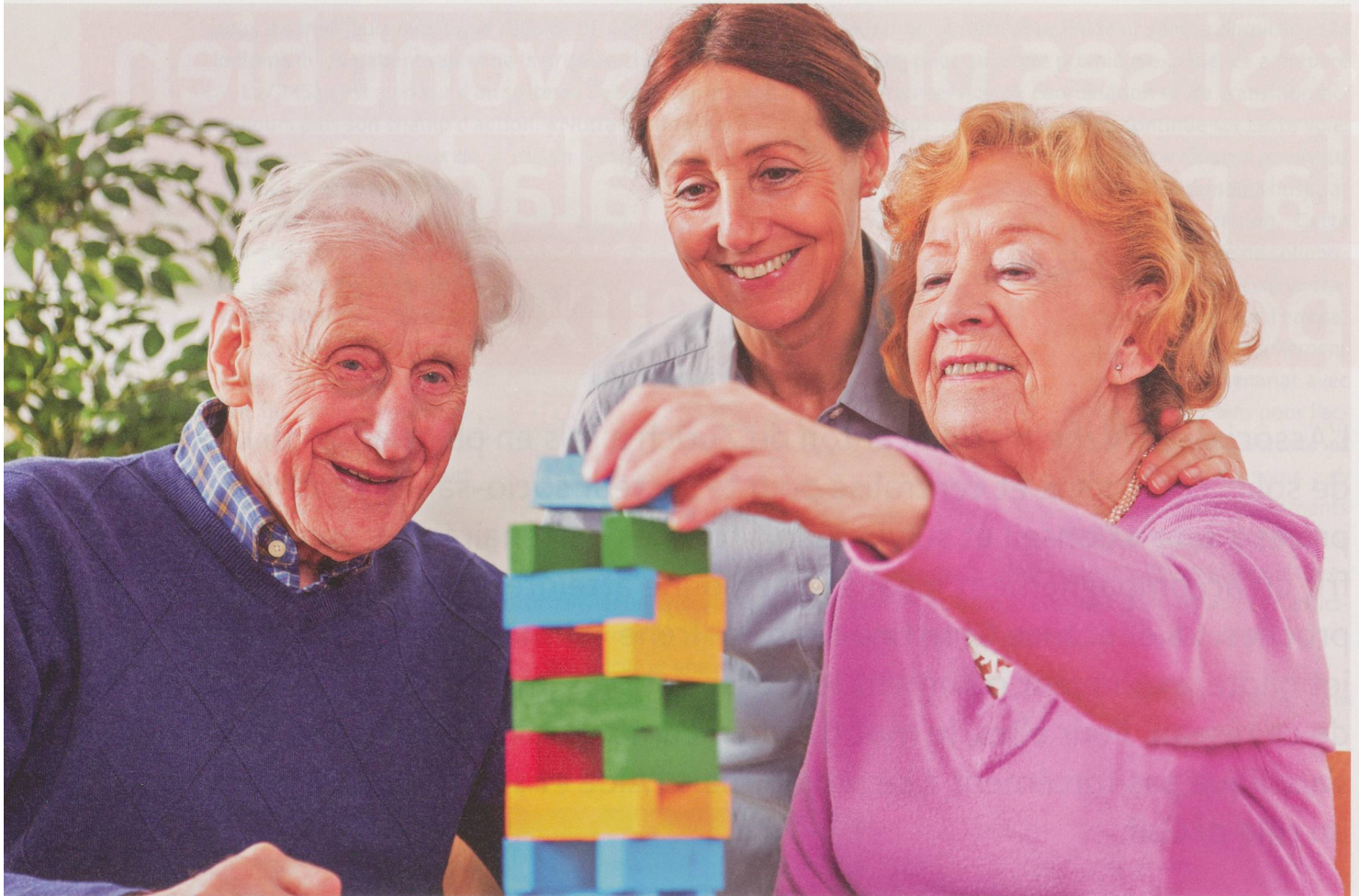
Une conseillère offre son expertise pour former un réseau autour de la personne malade et ses proches.

IT: D'autres outils scientifiques nous aident à prendre des décisions. Au moyen d'un questionnaire, il est possible de cerner ce qui décourage, dérange et pèse sur le quotidien d'un proche aidant. Est-ce le comportement agressif de la personne démente ou alors un manque de temps pour soi? Le proche aidant a-t-il besoin d'un groupe de parole qui puisse lui donner des conseils sur le long terme ou est-ce qu'un soutien et des soins lui sont immédiatement nécessaires?