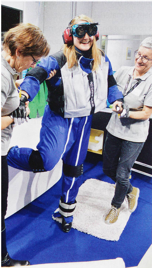
Le simulateur de vieillissement pèse lourd et entrave les mouvements.

Le salon Planète Santé s'est déroulé pour la première fois au CERM de Martigny, du 14 au 17 novembre. Cette édition a suscité un vaste engouement: elle a attiré 33 000 visiteurs. La rédaction y est allée.