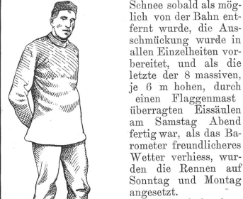
Peter Oestlund, Weltmeister im Schnellaufen pro 1898.

Das Wetter drohte allerdings einen Strich durch die Rechnung zu machen, indem seit dem 1. Februar 85 cm Schnee fiel. Eine Armee von Arbeitern, darunter zahlreiche Bürger des Ortes, sorgte jedoch dafür, dass der fallende Schnee sobald als möglich von der Bahn entfernt wurde, die Ausschmückung wurde in allen Einzelheiten vorbereitet, und als die letzte der 8 massiven, je 6 m hohen, durch einen Flaggenmast überragten Eissäulen am Samstag Abend fertig war, als das Barometer freundlicheres Wetter verhieß, wurden die Rennen auf Sonntag und Montag angesetzt.