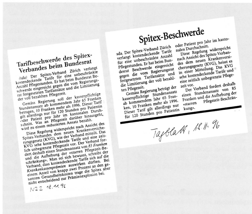
Gute Spitex-Präsenz in der Presse