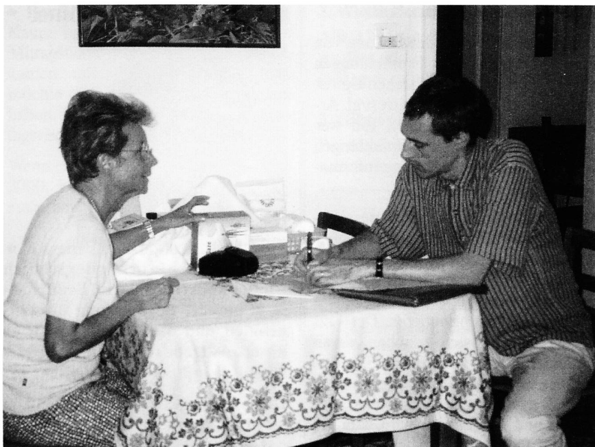
Das Procedere wird besprochen und schriftlich festgehalten.

begrüsst und als notwendig und sinnvoll erachtet, es wurden lediglich Zweifel an deren Umsetzung, vor allem ärztlicherseits, geäußert. Wichtig sei, dass die Einführung schrittweise geschehe und genug Zeit zur Verfügung stehe. Eine gewisse Resignation war für mich aus den Bemerkungen spürbar.