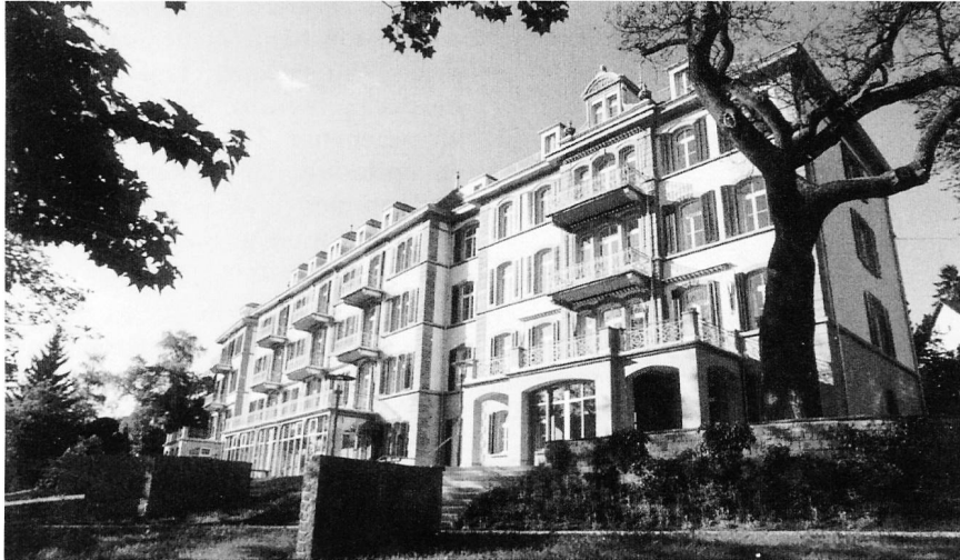
Gerontopsychiatrisches Zentrum Hegibach

Aus der Sicht des Gerontopsychiatrischen Zentrums Hegibach