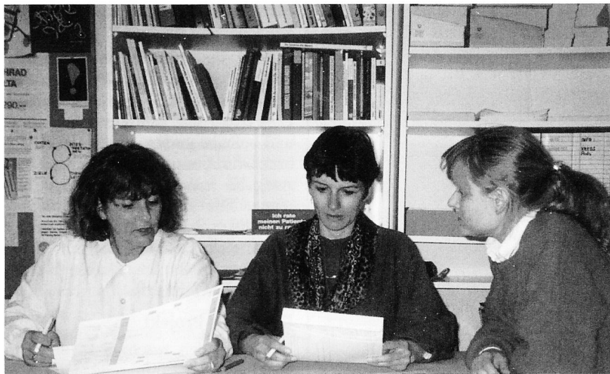
Die gemeinsame Austrittsplanung beginnt im besten Fall schon mit dem Eintritt ins Spital

Aufenthalt in seiner Wohnung in persönlicher Atmosphäre möglich wird. So soll eine erneute Hospitalisierung vermieden oder zumindest möglichst lange hinausgezögert werden. Dabei stehen folgende Aspekte im Vordergrund: