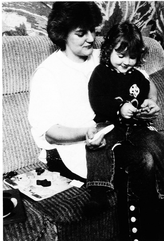
Der Bedarf des Familieneinsatzes wird leider oft ungenügend berücksichtigt