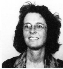
Liebe Leserinnen und Leser

Kann die Spitex Hilfe und Pflege zu Hause abbrechen oder gar verweigern? Dass diese Frage nicht einfach zu beantworten ist, wissen viele von Ihnen aus eigener täglicher Erfahrung. Wir haben trotzdem den Versuch gewagt, mögliche Antworten aufzuzeigen. Die Gespräche, die wir in diesem Zusammenhang führten, haben uns tief beeindruckt. Und die Berichte zu diesem Thema zeigen eines klar auf: Auch wenn in den letzten Jahren immer wieder neue Hilfsmittel zur Bewältigung schwieriger Einsätze bereitgestellt wurden – Einsatzkriterien, genau definierte Leistungsrahmen, institutionalisierte Fallbesprechungen und externe Teamsupervisionen – letztendlich bleibt den Mitarbeitenden der Spitex oft nichts anderes übrig, als weiterhin bei ganz schwierigen Klientinnen und Klienten Einsätze zu leisten. Und das ist ganz einfach bewundernswert.