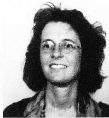
Liebe Leserinnen und Leser

Kann die Spitex Hilfe und Pflege zu Hause abbrechen oder gar verweigern? Dass diese Frage nicht einfach zu beantworten ist, wissen viele von Ihnen aus eigener täglicher Erfahrung. Wir haben trotzdem den Versuch gewagt, mögliche Antworten aufzuzeigen. Die Gespräche, die wir in diesem Zusammenhang führten, haben uns tief beeindruckt. Und die Berichte zu diesem Thema zeigen eines klar auf: Auch wenn in den letzten Jahren immer wieder neue Hilfsmittel zur Bewältigung schwieriger Einsätze bereitgestellt wurden – Einsatzkriterien, genau definierte Leistungsrahmen, institutionalisierte Fallbesprechungen und externe Teamsupervisionen – letztendlich bleibt den Mitarbeitenden der Spitex oft nichts anderes übrig, als weiterhin bei ganz schwierigen Klientinnen und Klienten Einsätze zu leisten. Und das ist ganz einfach bewundernswert.