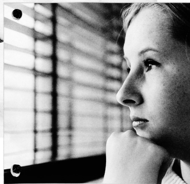
Der Auftrag der Spitex in der Hilfe und Pflege von psychisch kranken Menschen ist noch nicht geklärt.