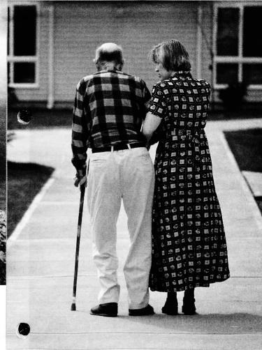
Werden ältere Menschen längere Zeit betreut, kann der Spitex-Dienst psychische Störungen rechtzeitig erkennen.