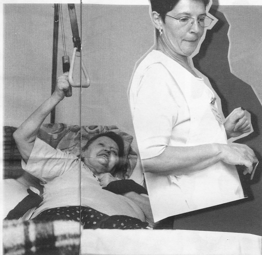
Ausweg aus dem Dilemma? Ein klares Managementkonzept, um die Adresse für das Leben und das Gesehen zu Hause zu werden.