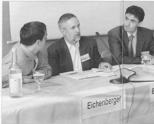
Um die Zukunft und Qualität der Spitex ging es in vielen Workshops.

Die sehr gute Qualität des schweizerischen Gesundheitswesens habe ihren Preis, indem unser Land bei den Gesamtaufwendungen auf dem 2. Platz nach den USA figure, stellte Stéphane Rossini, Professor an den Universitäten Neuenburg und Genf, fest. Bei der Finanzierung der Leistungen stelle sich die Frage, ob dies via das Sozialsystem oder durch die Benutzer, also die Klientinnen und Klienten sowie deren Krankenversicherungen, geschehen solle. Die heutige, ungefähr hälftige Aufteilung stehe angesichts der Zunahme von Bedürfnissen und Begehrlichkeiten zur Diskussion. Dabei schätzte Rossini die