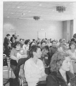
Konzentration – wie sie zwei Tage lang gefragt wor.

«Spitex kann fast alles leisten, wenn es finanziert wird!»