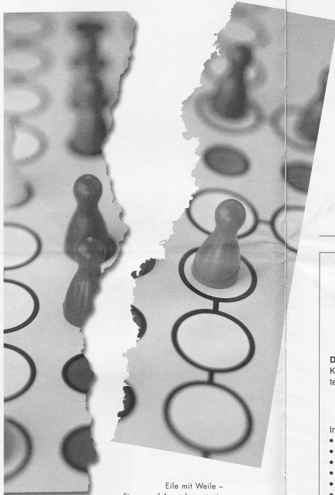
Eile mit Weile – Stress und Ausgebranntsein sind ein Nährboden für Gewalt und Aggression.

Das hat mit der Geschichte des Heimwesens zu tun. Das Heim ursprünglich als Armenhaus. Im Heim hat ein Teil des Pflegepersonals eher noch die Vorstellung, die Leute seien zu Besuch und das Personal habe den Umgang zu bestimmen. Im Spitex-Bereich ist es vermutlich umgekehrt: Dort hat das Personal wohl das Gefühl, zu Besuch zu sein bei den Menschen und eine entsprechende Achtung vor dem Privatbereich. Damit haben