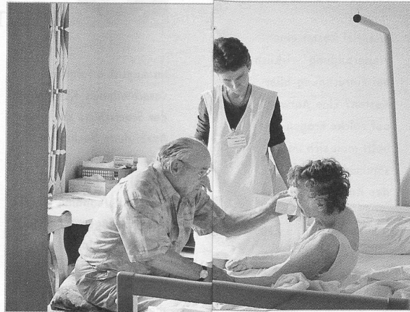
Pflegende Angehörige wollen stark und nicht schwach sein.

Neue Teilnehmerinnen und Teilnehmer zu finden ist jedoch schwierig, obwohl das Angebot unentgeltlich ist. Es braucht Mut, in eine Gruppe zu belasten. Vor allem ältere Menschen sind sich nicht gewöhnt, sich in einer Gruppe auszutauschen. Und oft ist auch ihr Alltag zu belastet. Es ist nicht einfach, sich einzugestehen, dass man nicht mehr weiter weiss und am Ende seiner Kräfte ist. Man will stark und nicht schwach sein. Wenn sich Angehörige dann öffnen, ist es immer