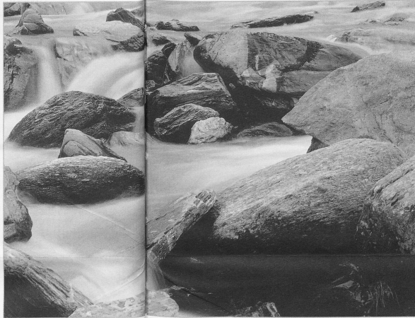
Gesundheitsförderung und Prävention helfen dem Menschen, sich im Fluss des Lebens sicher zu bewegen.