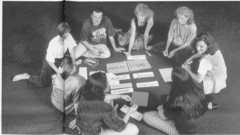
Betriebe, die Lernende aufnehmen, profitieren, müssen aber gleichzeitig bereit sein, sich herausfordern und hinterfragen zu lassen.

und Werbung für den Arbeitsplatz Spitex machen. Das alles bedeutet für die Organisationen eine grosse Umstellung und braucht Mut, ganz abgesehen von der anspruchsvollen Arbeit, die in Bereichen wie Selektion, Begleitung, Sicherheit für die Kundschaft usw. zu leisten ist.