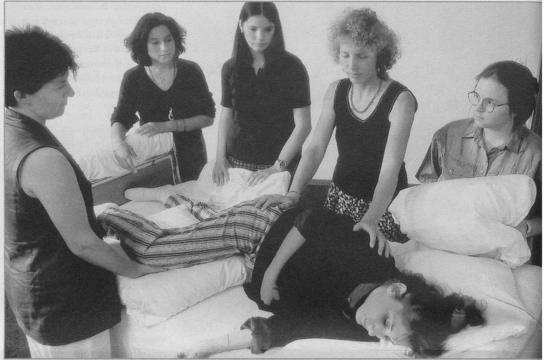
Noch unsicher ist, in welchen Ausbildungen es einen Schwerpunkt Spitex geben wird.

Es gäbe indessen noch einen anderen Weg: Man könnte beschliessen, auf der Tertiärstufe Pflegefachpersonen als Generalistinnen und Generalisten auszubilden und dann für den Bereich