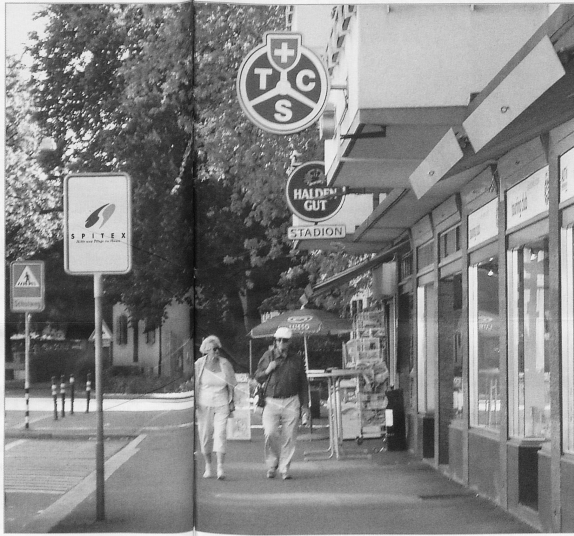
Kundenfreundlichkeit muss in der Spitex gross geschrieben werden.

wird schnell eine kritische Grenze erreicht, bei der es billiger wird, selber eine Haushilfe stundenweise anzustellen, als die Haushilfe über die Spitex zu orga-