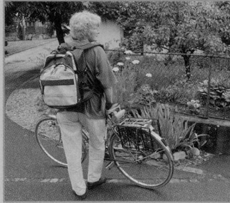
Bei den Stellen liegt Schaffhausen unter dem Durchschnitt.

Diese Tendenz bestätigt sich auch bei den Pflegequoten. Bei der