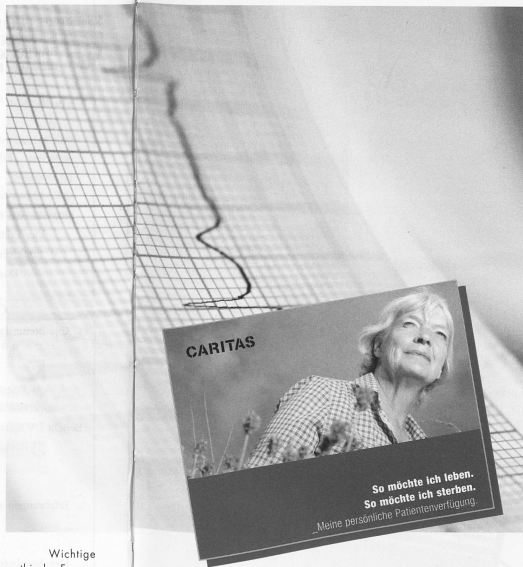
Wichtige ethische Fragen stellen sich am Lebensende: Wer entscheidet über lebenserhaltende Massnahmen?

Aber auch aus anderen Veränderungen entstehen neue ethische Dilemmasituationen: Spardruck, kulturelle Unterschiede sowohl beim Fachpersonal wie auch bei der Kundschaft, unterschiedliche Sichtweisen der verschiedenen Professionen und Zuständigkeitsprobleme, von denen gerade die Spítex oft besonders betroffen ist. Demenz, Patientenverfügungen