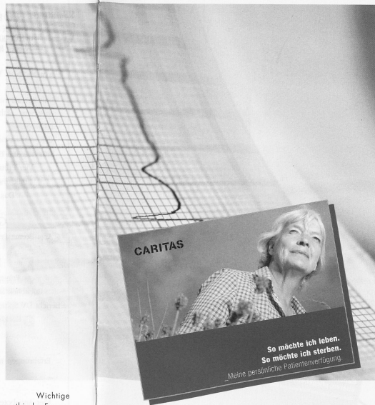
Wichtige ethische Fragen stellen sich am Lebensende: Wer entscheidet über lebenserhaltende Massnahmen?

Aber auch aus anderen Veränderungen entstehen neue ethische Dilemmasituationen: Spardruck, kulturelle Unterschiede sowohl beim Fachpersonal wie auch bei der Kundschaft, unterschiedliche Sichtweisen der verschiedenen Professionen und Zuständigkeitsprobleme, von denen gerade die Spítex oft besonders betroffen ist. Demenz, Patientenverfügungen