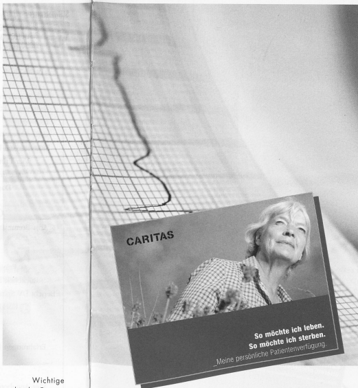
Wichtige ethische Fragen stellen sich am Lebensende: Wer entscheidet über lebenserhaltende Massnahmen?

Aber auch aus anderen Veränderungen entstehen neue ethische Dilemmasituationen: Spardruck, kulturelle Unterschiede sowohl beim Fachpersonal wie auch bei der Kundschaft, unterschiedliche Sichtweisen der verschiedenen Professionen und Zuständigkeitsprobleme, von denen gerade die Spítex oft besonders betroffen ist. Demenz, Patientenverfügungen