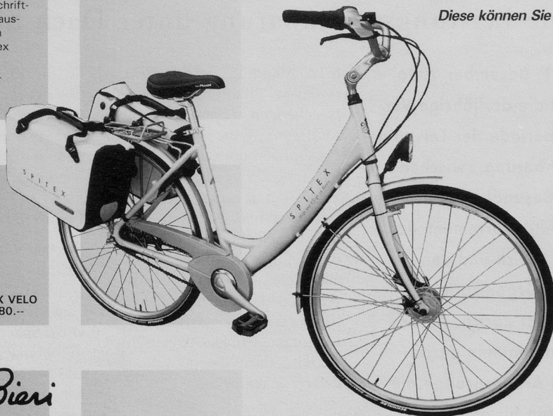
SPITEX VELO CHF 980.--

Mit den Spitexorganisationen der Städte Bern und Zürich haben wir für Sie bedürfnisorientierte SpiteX-Artikel entwickelt. Diese können Sie bei uns zum Selbstkostenpreis beziehen.