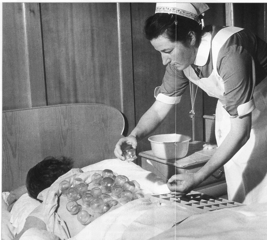
Das Wissen über alte Heilmethoden soll nicht verloren gehen.

In der Hektik des Tagesgeschäftes fehlt oft die Zeit, Dossiers so zu archivieren, dass sie von künftigen Geschichtsforschenden untersucht werden können. Zu oft kommt es vor, dass Unterlagen unsachgemäss entsorgt werden. Rudimentäre Archive erschweren eine seriöse Forschung. Der Verein «Geschichte der Pflege», den Vertreterinnen und Vertreter der Pflege und der Geschichtswissenschaft 2004 in Basel gründeten, hat sich zum Ziel gesetzt, in den Bereichen Archivierung, Forschung und Vermittlung tätig zu werden. Er berät bei der Erschliessung von Archivbeständen, fördert Forschungsarbeiten zur Geschichte der Pflege und führt Tagungen zu historischen Themen durch.