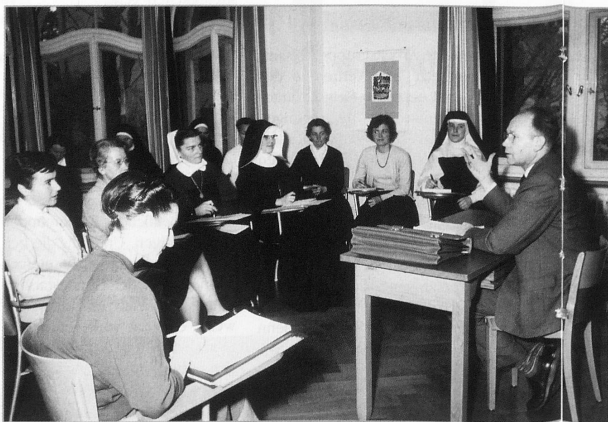
Krankenschwestern, Ordensfrauen und Diakonissen in der Weiterbildung an der SRK-Fortbildungsschule in Zürich um 1955.

So organisiert der Verein am 17. März in Basel den 7. Internationalen Kongress zur Geschichte der Pflege (siehe Kasten). Die Veranstaltung richtet sich an alle, die sich für die Geschichte ihres Berufes interessieren und erfahren wollen, an welchen Themen aktuell geforscht wird. Sie gibt Berufsberechtigten die Chance, sich mit neuen Forschungserkenntnissen auseinanderzusetzen und mit Forschenden in eine Diskussion zu treten.