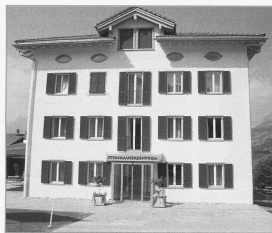
Alterswohnungen in Obersaxen: mit Spitez als zweckmässiger und wirtschaftlicher Lösung.

Auch im Institut St. Joseph, einem Dominikanerinnenkloster, war das Argument, mit den Kassen abrechnen zu können, zwar nicht