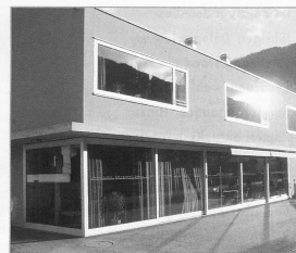
Pflegewohngruppe in der Gemeinde Vals: Die Führung wurde der Spitez übertragen.