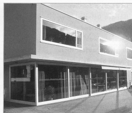
Pflegewohngruppe in der Gemeinde Vals: Die Führung wurde der Spitez übertragen.

Organisation übergeben werden soll. Der Entscheid fiel klar zu Gunsten der Spitez aus. Die Führung der Pflegewohngruppe ist in der Folge der Spitez übertragen worden. Mit einer Vereinbarung zwischen der Gemeinde Vals und der Spitez Foppa ist der Auftrag über die Führung geregelt worden. 15 der insgesamt 58 Mitarbeiterinnen der Spitez Foppa sind heute in der Pflegewohngruppe im Einsatz.