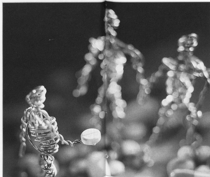
Ein bekannter Fehler: Medikamente werden verwechselt oder falsch dosiert.

Auch das weitere Vorgehen kann im Spitex-Bereich weit aufwändiger sein als im Spital: «Wenn nach einem Fehler – beispielsweise mit der Medikamentendosierung –