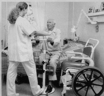
Deckenliftsysteme, Patientenheber, Transferhilfen, Haltegriffe, Pflegebetten, Kissen, Matratzen und -Schutzauflagen, Aufstehhilfen, Hilfen rund ums Bett, Bade- und Toilettenhilfen, Ess- und Trinkhilfen, Anziehilfen usw.

Als Qualitäts- und Ausbildungsverantwortliche war ich am Arbeitsplatz mit vielen Fragen konfrontiert. Dort kam der Wunsch