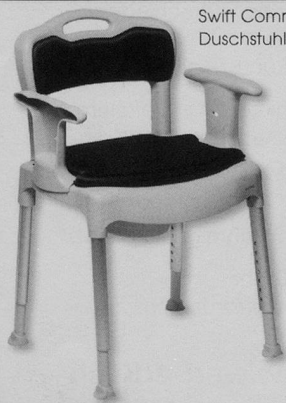
Swift Commode ist ein zerlegbarer Toilettenstuhl mit Sitzhöhenverstellung. Kann auch als Toilettenhöhung über die Toilette gestellt oder als Duschstuhl verwendet werden.

erlaubte keine vertiefte Analyse der Ergebnisse. Wir müssen daher die interessierten Leserinnen und Leser auf die nächste Schauplatz-Ausgabe vertrusten, in der wir ausführlich über die Ergebnisse berichten werden. Nur soviel sei vorweggenommen: Die Zufriedenheit von Kundinnen und Kunden ist auch bei dieser Befragung erfreulich hoch.