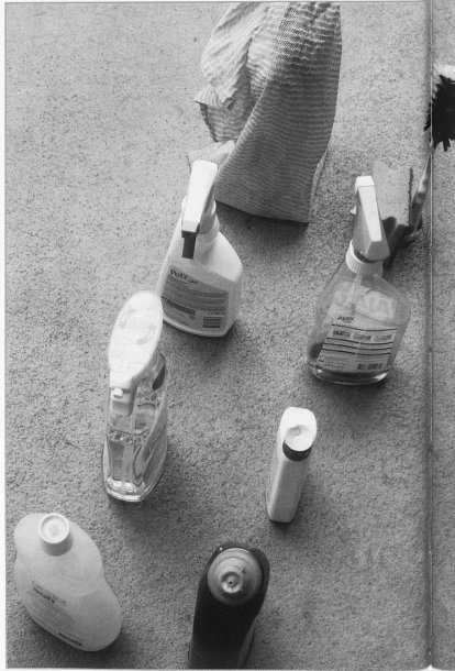
Wie früher bei den Adligen: Bedienstete bringen den Haushalt von Reichen in einen sauberen und geordneten Zustand. Das hat nichts mit hauswirtschaftlichen Dienstleistungen in der Spitex zu tun.

Trotz leicht steigenden HW-Kundenzahlen ist der Anteil der Hauswirtschaft in der Spitex stark rückläufig. Ursache dafür ist nicht nur, wie bereits festgelegt, die rückläufige Stundenzahl in der Hauswirtschaft, sondern auch die stark anwachsende Pflegeintensität der Spitex, weil die Pflege immer mehr in den ambulanten Bereich verschoben wird und die Komplexität steigt. Bei in etwa konstanter Klientenzahl in der Hauswirtschaft sind die verrechneten