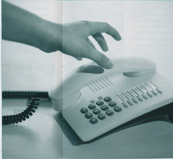
Im Rahmen des Projekts «Qualitätsindikatoren» wurde deutlich, wie wichtig eine genaue Erfassung des Klientenzustandes bei der Bedarfsklärung ist.

gruppen mit gleichen Phänomenen ausgerichtet. Damit können sie den Spitex-Organisationen wertvolle Hinweise liefern, wie effektiv ihre Massnahmen zur Zielerreichung bei der entsprechenden Klientengruppe sind.