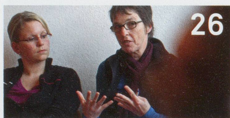
Psychiatrie: Arbeit im Netzwerk