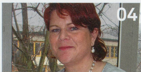
In der Spitex Karriere machen