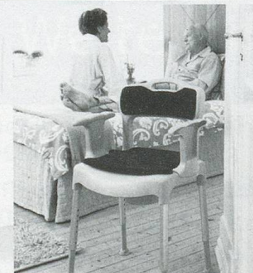
Nachtstuhl SWIFT Commode

Leichter durch den Alltag Produkte für mehr Lebensqualität