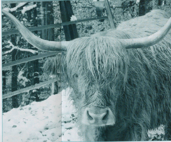
Simonette, das zwölfjährige Hochlandrind vom Josthof.