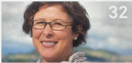
Monatsinterview mit Walter Suter, Präsident Spitex Verband Schweiz