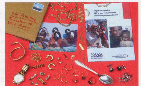
Dank Altgoldspenden können Blinde wieder sehen. 50 Franken kostet eine Graue-Star-Operation.

Wenn Sie beim Zahnarzt eine Behandlung machen müssen, können Sie das extrahierte Zahngold dem Roten Kreuz spenden. Die Zahnärzte in der Schweiz sind informiert und stellen Ihnen reissfeste Kuverts zur Verfügung.