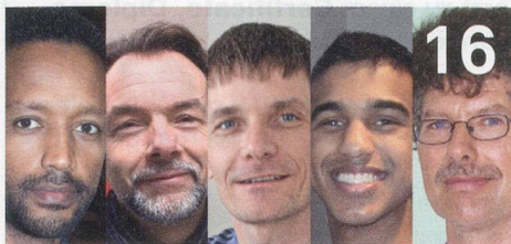
Pflegerische Männer: SpiteX-Mitarbeiter erzählen aus dem Berufsalltag