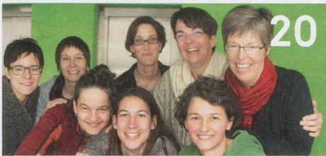
Pionierarbeit: Luzerner Brückendienst für die Pflege von Schwerkranken