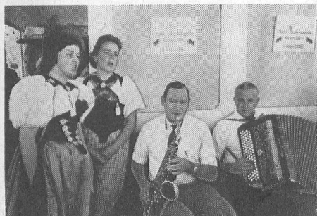
Unsere «Home»-Kapelle «Bärnerstörn». – Notre petit orchestre champêtre «Bärnerstörn».