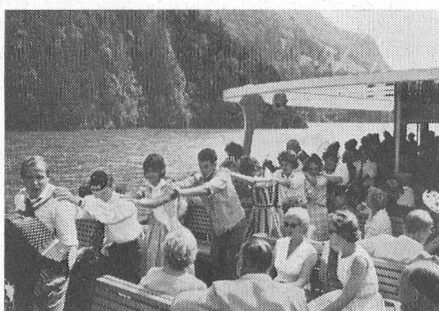
Fröhliche Polonaise auf dem Dampfer «Schwyz». – Polonaise des jeunes sur le bateau «Schwyz».

die Freiheit von den Urkantonen ausgegangen sei; er deutete das Rathaus als ein Symbol der Demokratie, es sei überhöht von der Kirche, beide sollen zusammen die grossen ordnenden Kräfte der Gemeinschaft bilden. Die Mythen sahen die Eidgenossenschaft entstehen, sie sahen die alten Helden, denen der Mut mit der Grösse der Gefahr wuchs und die im Glauben an die Zukunft, im Vertrauen auf die eigene Kraft und die überirdische Allmacht ihre Siege errungen haben.