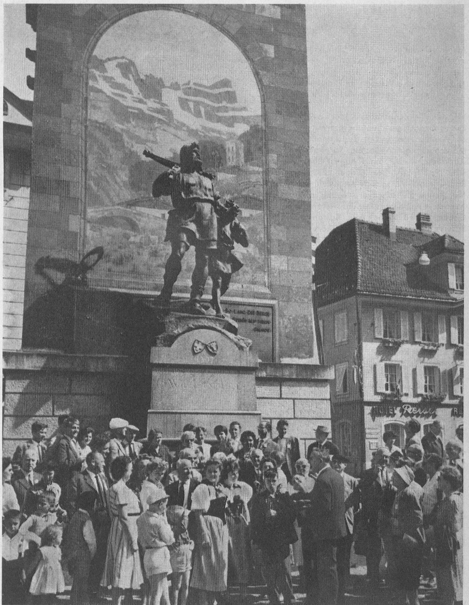
Unsere «Home»-Gäste vor dem Telldenkmal in Altdorf (Uri). – Nos hôtes du «Home» devant le monument de Guillaume Tell à Altdorf (Uri).