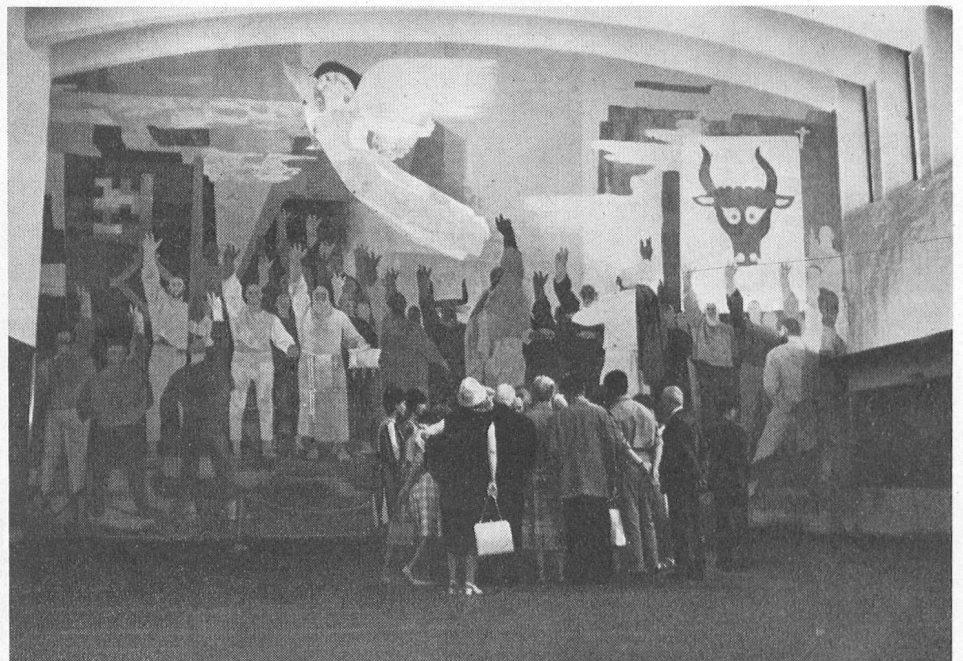
Hier bewundern sie das grosse Wandgemälde Clénins - Ils admirent ici la grande peinture murale de Clénin.

«Home» pour Suisses de l'étranger... un pied-à-terre dans la patrie