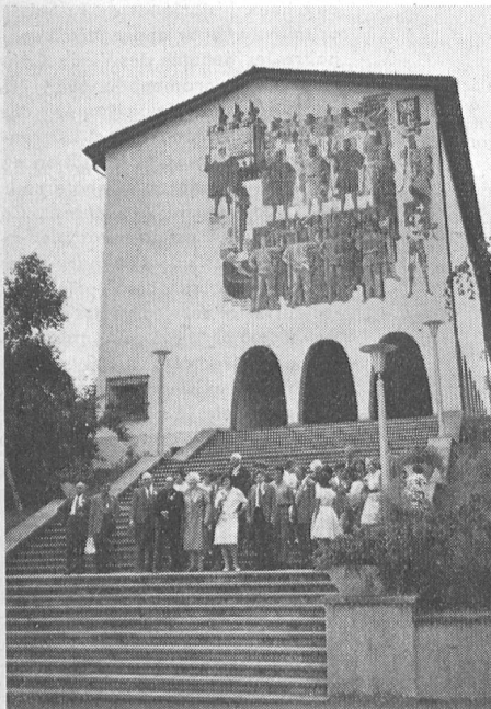
Unsere «Home»-Gäste vor dem Bundesbriefarchiv - Nos hôtes du «Home» devant les Archives fédérales.

Besuch unserer «Home»-Gäste Visite de nos hôtes du «Home»