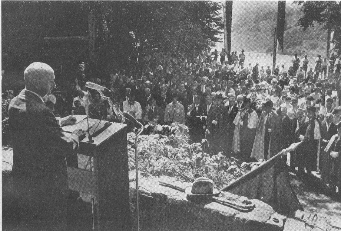
An der 25-Jahr-Feier Hohle Gasse (Küssnacht a/R) sprach alt Bundesrat Dr. h. c. Philipp Etter in begeisterten Worten zur Schweizer Jugend. Im Hintergrund (rechts) unsere über 100 Auslandsschweizer-«Home»-Gäste, die er in französischer Sprache begrüßte. – M. Philippe Etter, ancien conseiller fédéral, s'adressant à la jeunesse suisse à l'occasion de la Fête nationale et du 25 e anniversaire du fameux «Chemin Creux» de Küssnacht/Righi. Au fond (à droite) plus de 100 hôtes de notre «Home» auxquels il souhaita la bienvenue en langue française.

Schweizer Jugend in der Hohlen Gasse in Küssnacht a/Rigi