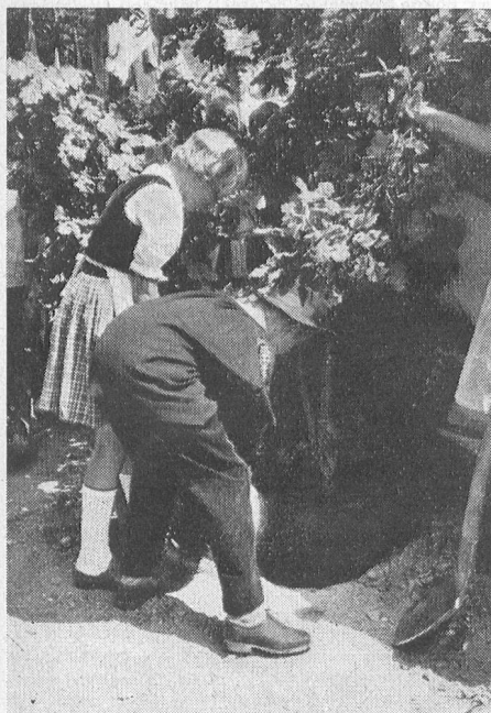
Die Schweizer Jugend pflanzt eine Erinnerungseiche und überbringt Erde aus jedem Kanton. – La jeunesse suisse plante un chêne et dépose de la terre de leur canton.