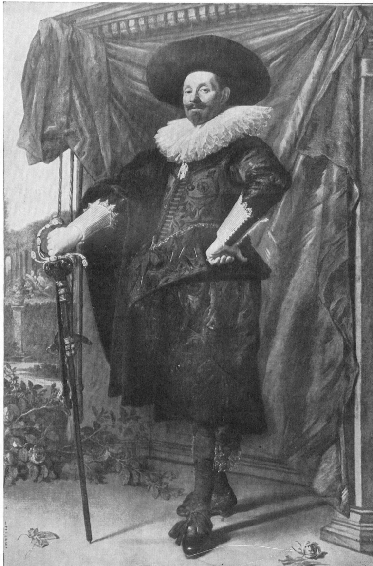
VI. Frans Hals: Bildnis des Willem van Heythuysen

Herausgegeben vom Schweizer-Verein im Fürstentum Liechtenstein, Vaduz