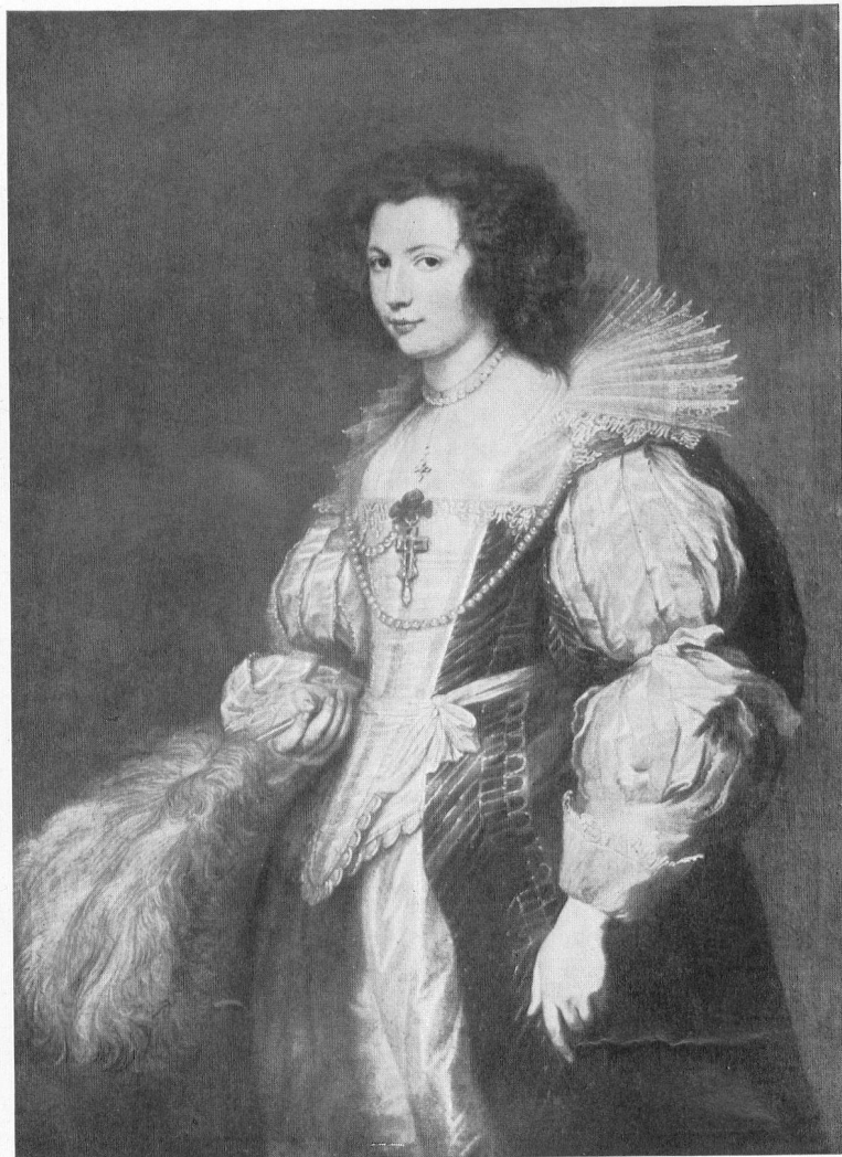
Anton van Dyck; Maria Luise von Tassis (Gemälde aus der Sammlung des Fürsten von Liechtenstein)

Redaktion und Administration: Schweizer-Verein im Fürstentum Liechtenstein, Postfach, Vaduz