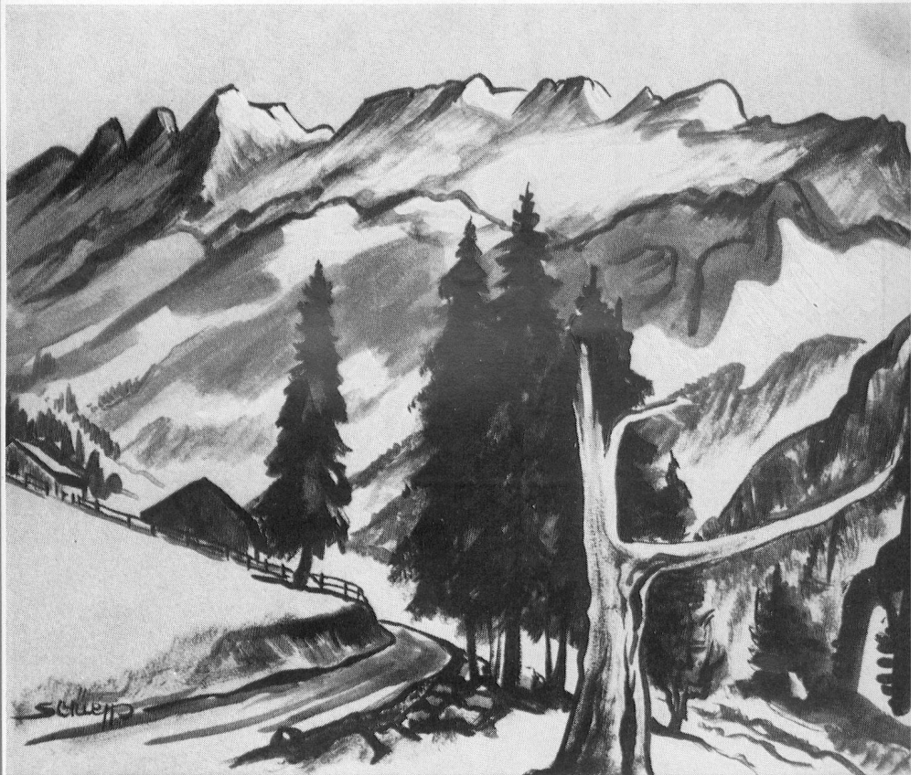
«Lavena Alp» (Tuschzeichnung von Kunstmaler Eugen Schüepp)