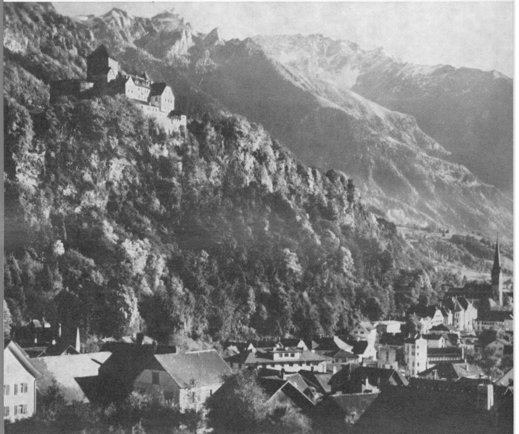
Vaduz, Hauptort des Fürstentums Liechtenstein