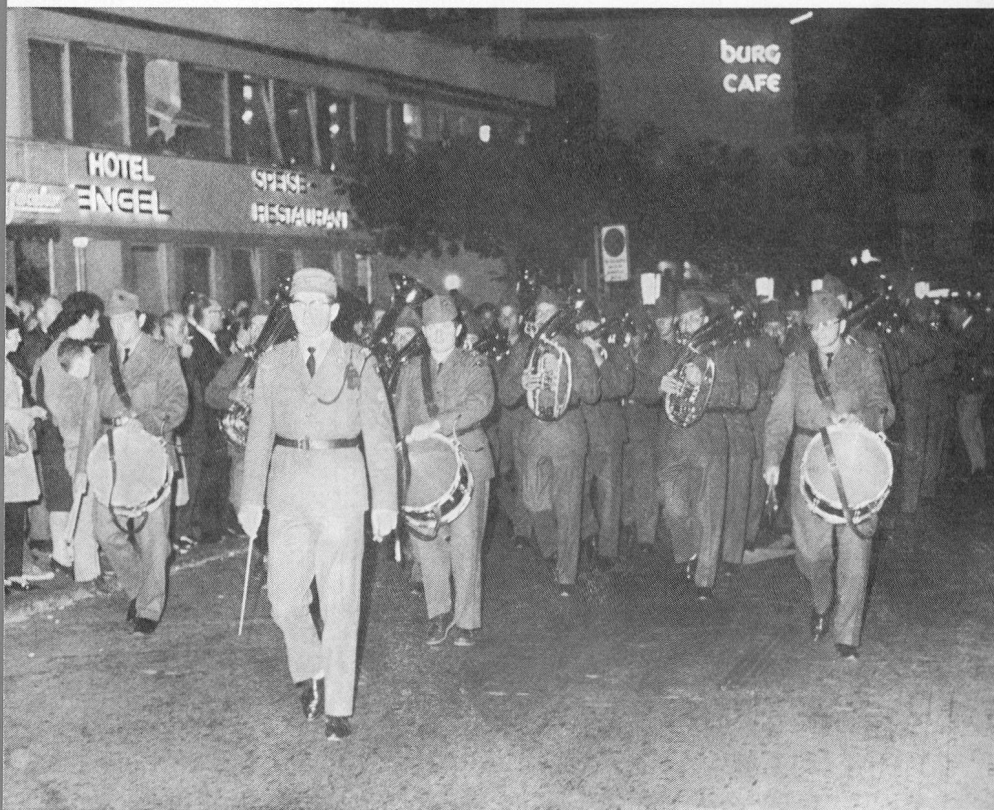
Das Spiel des Infanterie-Regimentes 72 in Vaduz