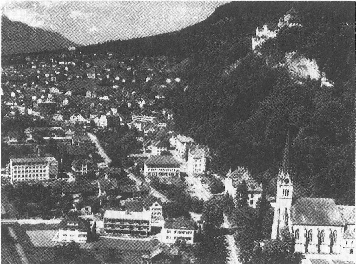
Vaduz - Hauptort des Fürstentums

Indem ich meine Landtagsrede beendige, will ich Gott inständig bitten, er möge, sehr geehrte Herren Abgeordnete, ihre Arbeit segnen, damit sie wohlgetan sei und Früchte trage."