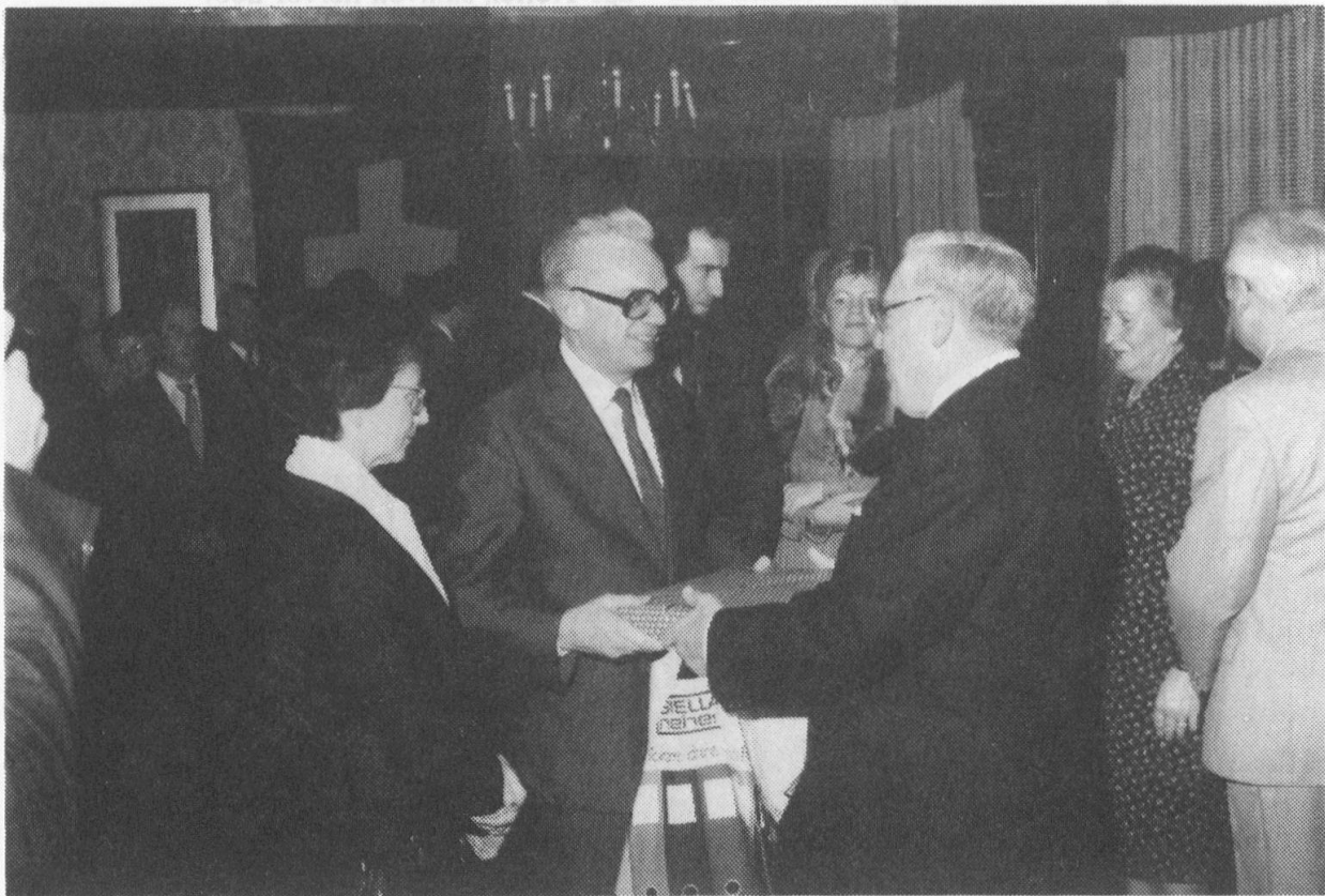
Die Ueberreichung eines Gastgeschenks an Bundesrat Schlumpf.