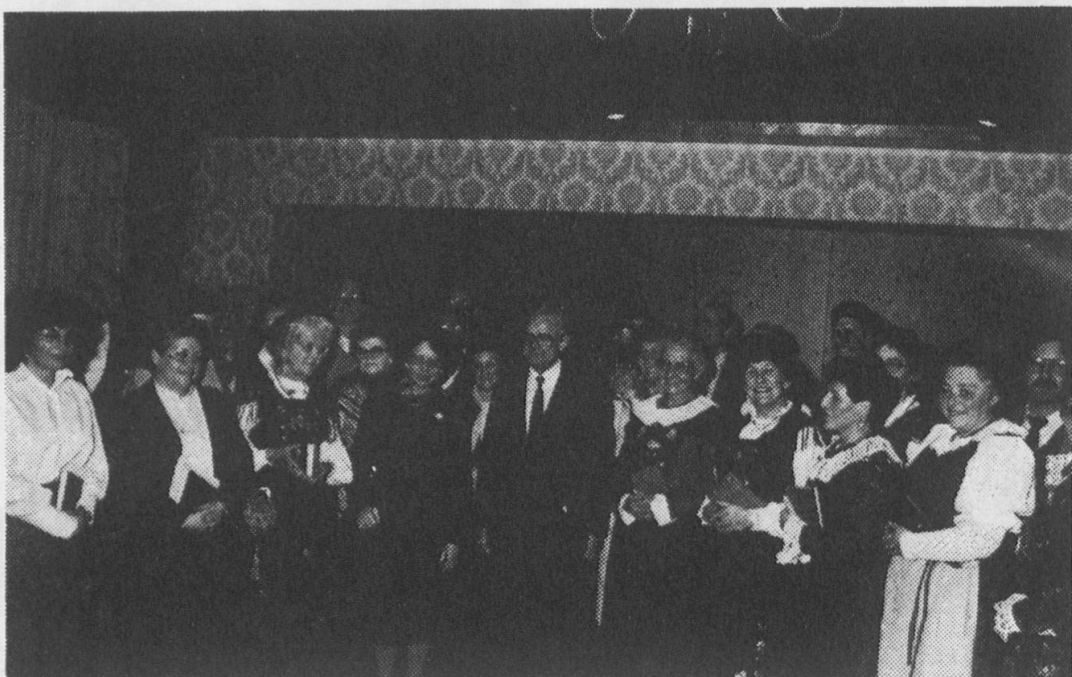
Unser Bild zeigt den Chor «Chrischun» des Bündnervereins Buchs.

Den hohen Besuchern aus Bern, vorab Bundesrat Schlumpf und seinen Begleitern und den Gattinnen, wie auch Werner Stettler, dem Präsidenten des Schweizervereins, sei für den unvergesslichen Empfang herzlich gedankt.