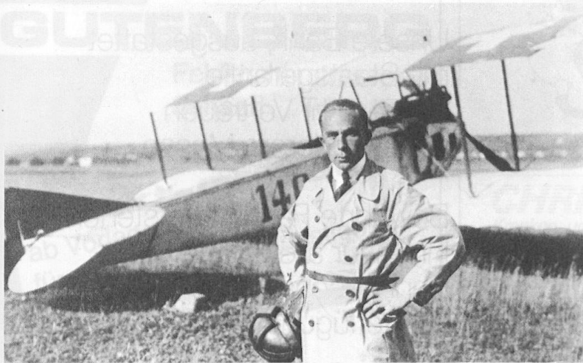
Walter Mittelholzer als Militätpilot...

und mit seiner Dornier-Merkur über dem Matterhorn.