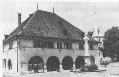
Hôtel des six communes, Môtiers.

Der Heimatschutztaler 1987 wird für das Neuenburger Jura-dorf Môtiers im Val de Travers rollen. Mit Unterstützung des Verkaufserlöses sollen nun rund 30 Häuser restauriert werden. Über drei Jahre lang – 1762 bis 1765 – lebte hier der Philosoph Jean-Jacques Rousseau. Môtiers ist heute noch so wie zur Zeit Rousseaus ein Dorf wie aus dem Bilderbuch.