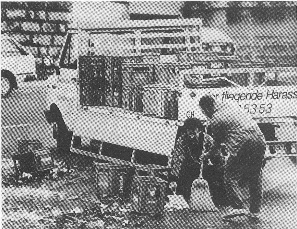
Harasse können, wie sich dieser Tage in Zürich 6 bestätigt hat, nicht fliegen.

nehmen war –, steht seit einigen Tagen fest: Als ein Lieferwagen des Hauses mit vermutlich zu wenig gesicherter Ladung bei der Einmündung der Sonnegg- in die Weinbergstrasse in die Kurve gesteuert wurde, nahmen einige Harasse den Firmennamen beim Wort und hoben ab, doch die hochfliegenden Pläne der Flaschen zerschlugen sich jämmerlich am Boden. Die Getränke wurden für einmal nicht in den Keller, sondern franko Strasse geliefert. Da sich der Schaden in Grenzen hielt, ist zu hoffen, dass es zu keinem Scherbengericht kommt.