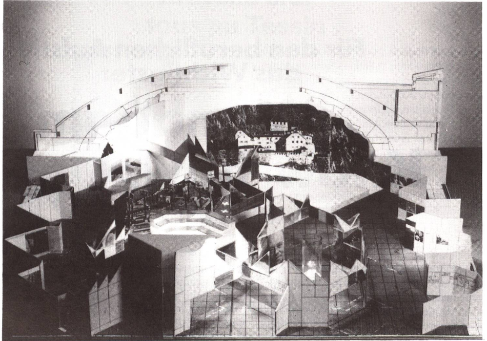
Liechtenstein stellt sich als Gastland beim Comptoir Suisse in Lausanne wirtschaftlich, kulturell und sportlich vor. Unser Bild zeigt das Ausstellungsmodell, das vom Atelier Louis Jäger geschaffen wurde.

Das Konzept der liechtensteinischen Präsenz in Lausanne, bei der Staat, Wirtschaft, Kultur und Sport zusammenarbeiten, stellt neben einer ganzheitlichen Darstellung des Landes die menschliche Begegnung in den Vordergrund. Mehr als 20 Gruppen und Vereine gestalten ein abwechslungsreiches sportliches und kulturelles Veranstaltungsprogramm in und um Lausanne. Dazu kommen Auftritte liechtensteinischer Vereine und Gruppen in der Liechtenstein-Halle, im Ausstellungsgelände (Palais de Beaulieu) sowie Spezialausstellungen ausserhalb des Comptoir-Geländes – eine Briefmarkenausstellung im Musée Olympique, die Ausstellung «Zeitgenössisches Kunstschaffen aus Liechtenstein» in Pully und eine Liechtenstein-Ausstellung im Rathaus der Stadt Lausanne.